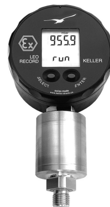
LEO Record Ei con sensor capacitivo